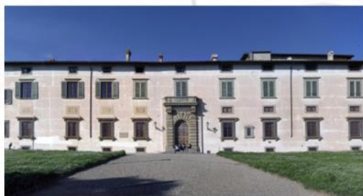
Sala Conferenze dell'Accademia della Crusca

Piano terra, superato l'ingresso, a destra