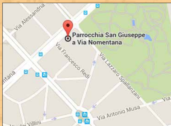
Église San Giuseppe